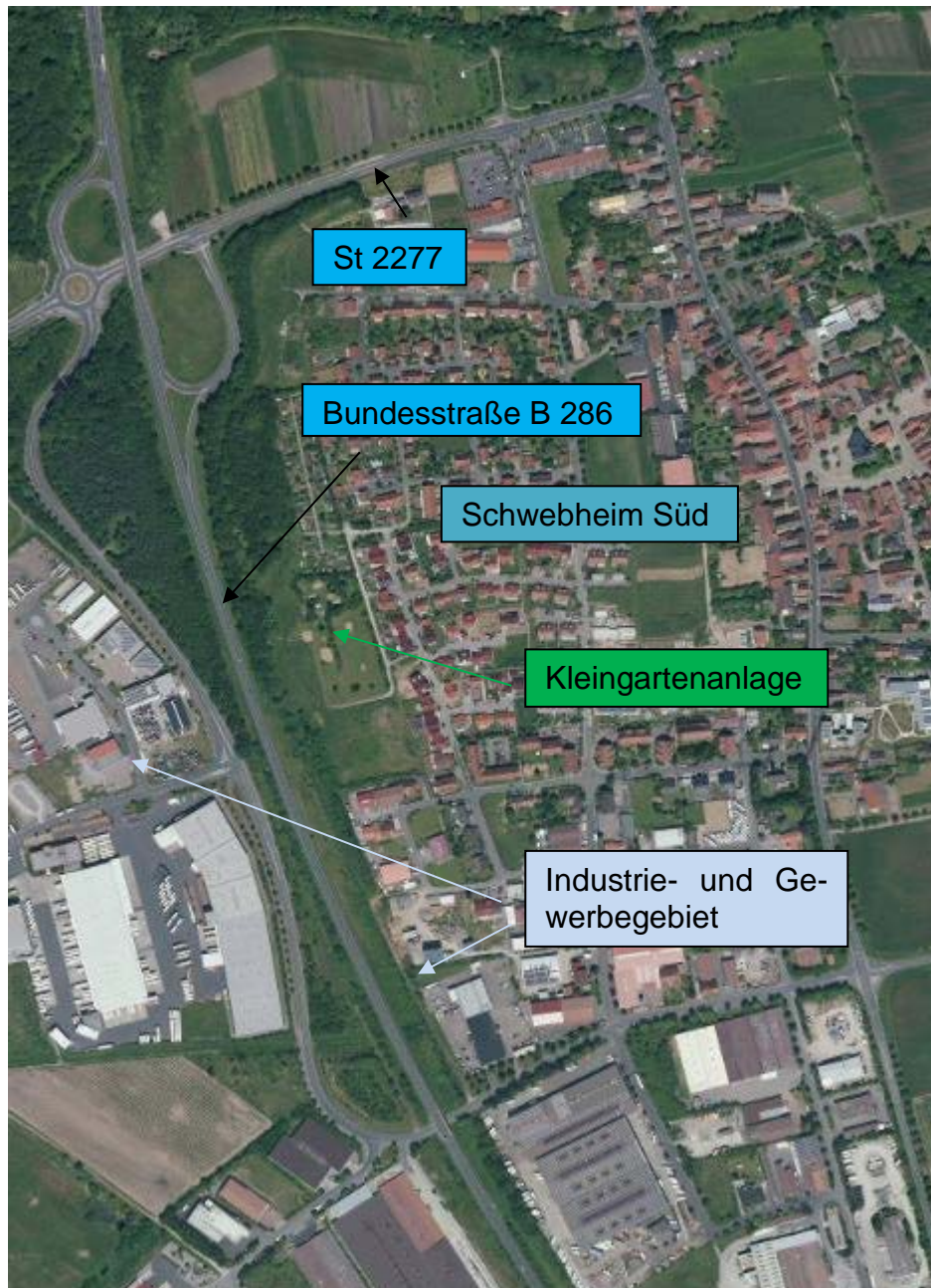
Abbildung 3 : Schwebheim Süd (Wohngebiet, Kleingartenbereich, Industrie- und Gewerbegebiet) mit B 286 und St 2277 (Bestand)

Abbildung 3 zeigt die örtliche Situation der Bebauung von Schwebheim südlich der St 2277 im Bestand.