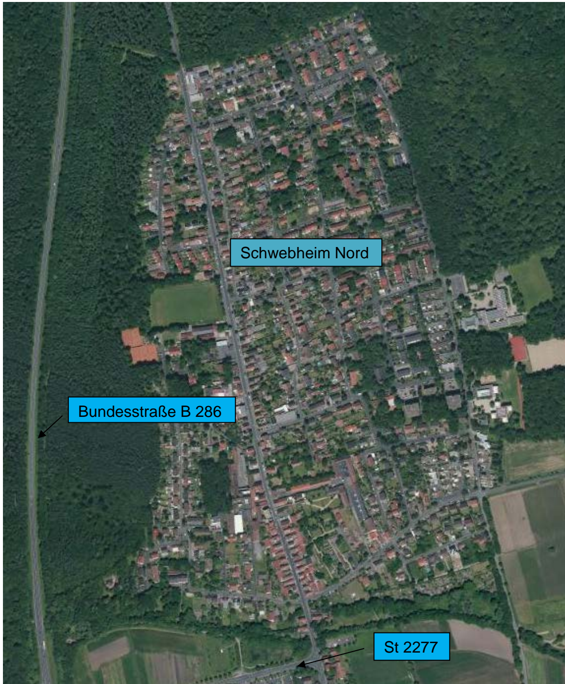
Abbildung 2 : Schwebheim Nord mit B 286 und St 2277 (Bestand)

Abbildung 2 zeigt die örtliche Situation des Wohngebietes von Schwebheim nördlich der St 2277 im Bestand.