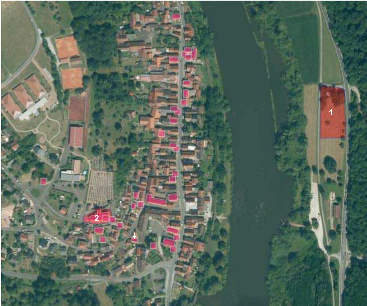
Abbildung 2: Bodendenkmäler im UG

■ Bodendenkmal (Benehmen nicht hergestellt) ■ Baudenkmal (Benehmen hergestellt)